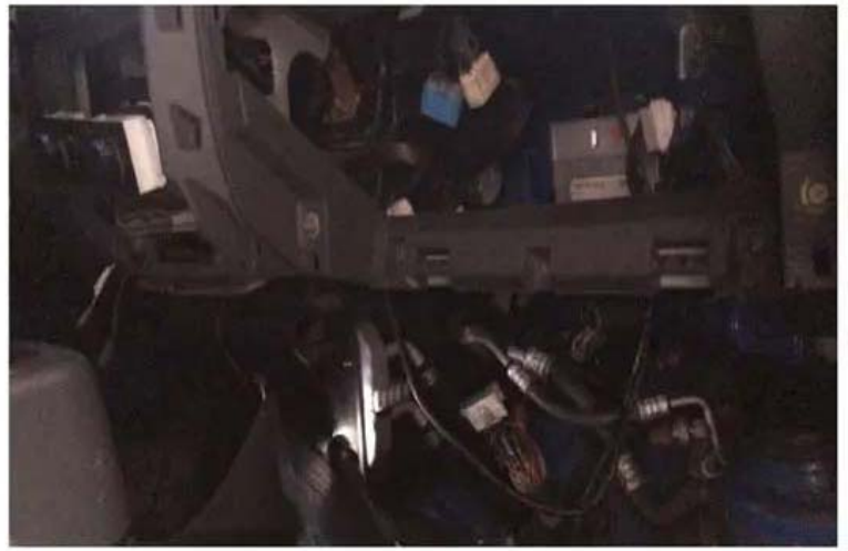
下圖為菱利貨車冷氣系統之線路