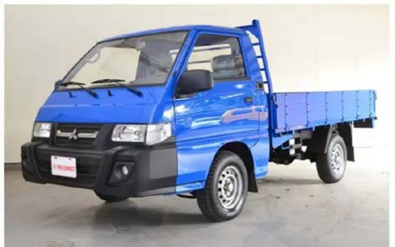
上圖為得利卡車型示意圖

得利卡車型因為年份不同，送車速訊號給儀表板的型式也不同，較舊款的為路碼表齒輪及路碼表線得，較新款的則是電子式的。